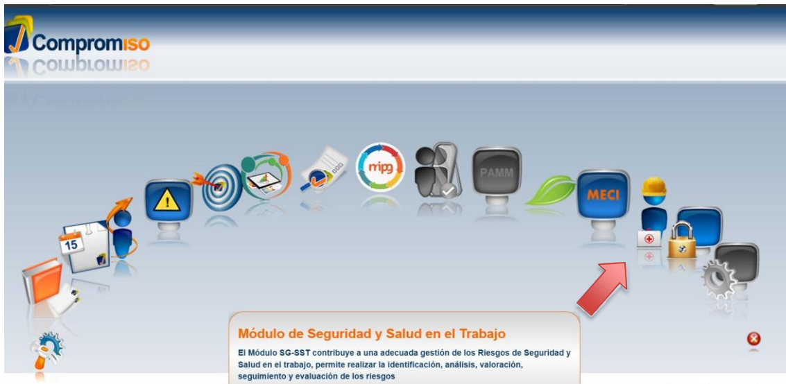
Imagen 5. Módulo de Seguridad y Salud en el Trabajo

Dentro de la plataforma compromiso, reposa por el módulo de Seguridad y Salud en el Trabajo, los planes de emergencias a nivel país, donde registran las amenazas a las cuales se encuentran expuestos, o identificación por medio de la observación y la evaluación de la amenaza. Así mismo contiene los insumos para la atención de emergencia, recurso humano, que en este caso sería la Brigada de Emergencia, el cómo actuar antes durante y después, la cadena de llamadas, el histórico de los reportes que se hallan presentado, la vinculación a los comités de ayuda mutua y el registro de las entidades que nos prestarían apoyo al momento la materialización de una emergencia.