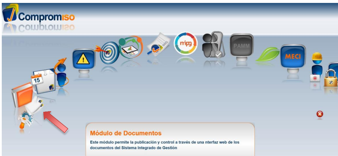
Imagen 1. plataforma compromiso – módulo de documentos

A continuación, se ilustra el módulo de documentos para tener acceso a la Guía de Prevención y Atención de Emergencias - GOR-F-004